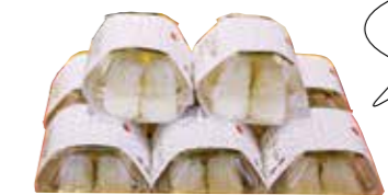
おむすび用の「結び米」を使った塩むすび