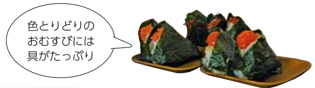
色とりどりのおむすびには具がたっぷり