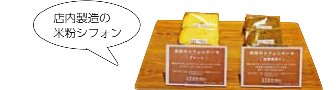
店内製造の米粉シフォン