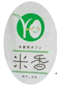
お店前のロゴが目印