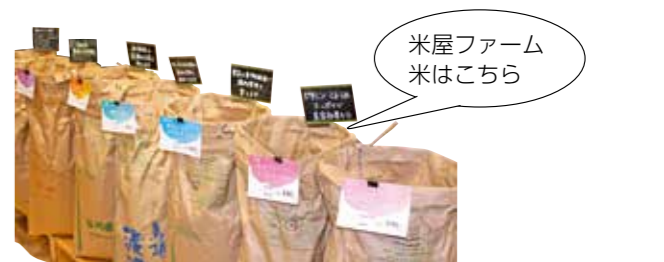
米屋ファーム米はこちら

野々市市の米屋では加賀地方から能登地方まで幅広い産地と生産者の米を取り扱っている。取引先に卸す際、需要に合わせて、ブレンド米を提案してきた。そのノウハウを生かして、セレクトショップ